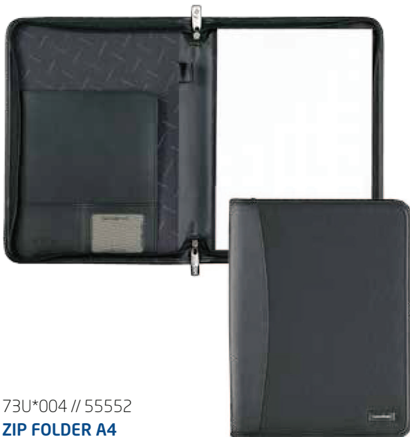
73U*004 // 55552 ZIP FOLDER A4 SCHREIBMAPPE DIN A4 MIT RV SERVIETTE ECRITOIRE DIN A4 A FERMETURE ZIP 25 x 33 x 2,5 cm