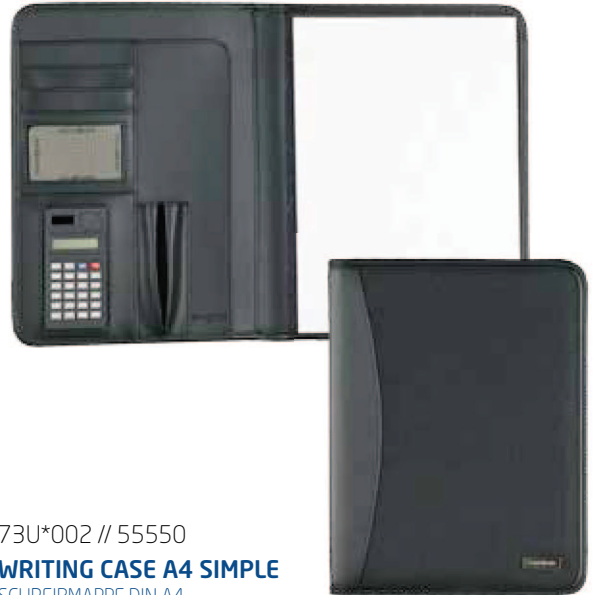
73U*002 // 55550 WRITING CASE A4 SIMPLE SCHREIBMAPPE DIN A4 SERVIETTE ECRITOIRE DIN A4 24 x 31 x 2 cm