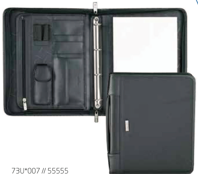
73U*007 // 55555 ZIP FOLDER A4TOP H+BINDER SCHREIBMAPPE DIN A4 MIT RV+ GRIFF + HERAUSNEHMBARE RINGLEISTE POCHETTE ORGANISEUR DIN A4 A FERMETURE ZIP + POIGNEE + ANNEAUX AMOVIBLES 29,5 x 34 x 5 cm