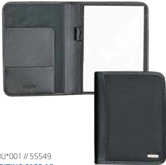
73U*001 // 55549 WRITING CASE A5 SCHREIBMAPPE DIN A5 SERVIETTE ECRITOIRE DIN A5 17,5 x 22,5 x 2 cm